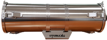
본체 및 브라켓