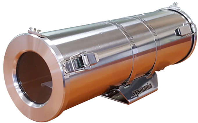
ISH-400, 500, 600, 800 Industrial Stainless Housing