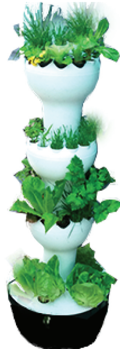
제품명: 버티칼 팜 44 코드명: [112-001]