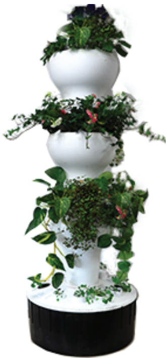
제품명: 버티칼 팜 32 코드명: [122-001]