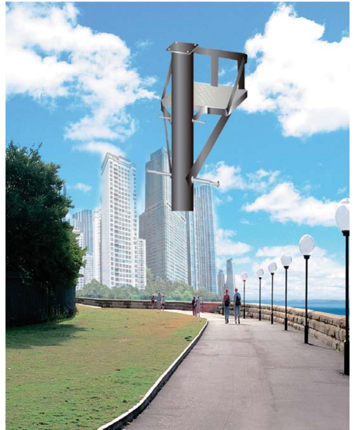
본 제품은 성능향상을 위해 사전에 예고없이 외관 및 성능이 변경될 수 있습니다.