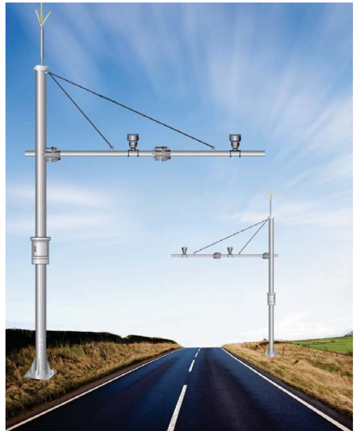
본 제품은 성능향상을 위해 사전에 예고없이 외관 및 성능이 변경될 수 있습니다.